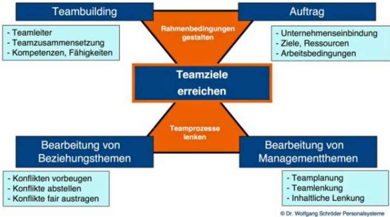
Abbildung 1: Erfolgsfaktor 1 - Rahmenbedingungen von Teams

Mehr als 50 Prozent der Erfolgsursachen von Teamarbeit liegen in der bewussten Gestaltung der Rahmenbedingungen für Teams.